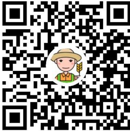
施肥监测通二维码